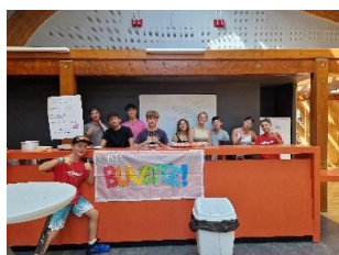
Première action d'autofinancement des jeunes de l'accueil ados au forum des associations

Les animations au collège de Coublevie : les mardis de 12h à 14h à partir du 3 octobre.